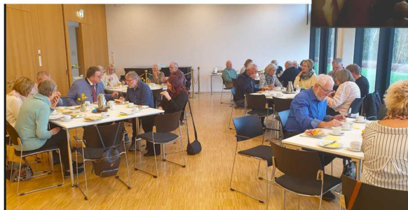
Feier der Osternacht und Osterfrühstück auf dem Kohlhagen