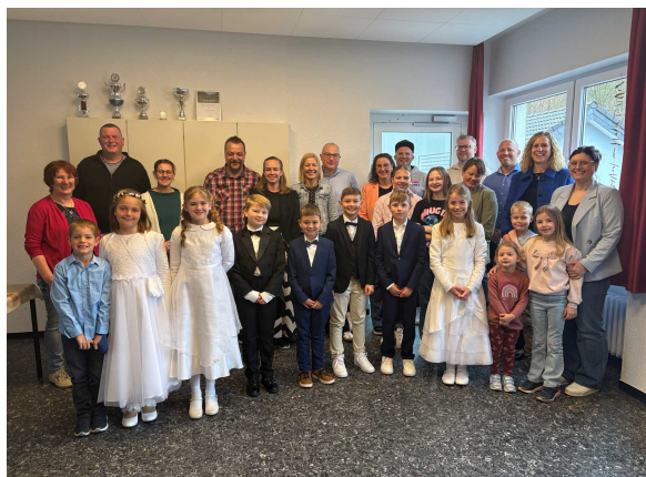
Frühstück der Kommunionkinder im Pfarrzentrum Kirchhundem am 13. April